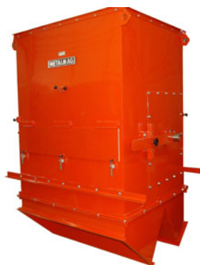
Tambor com diâmetro maior, para grandes vazões e alto desempenho