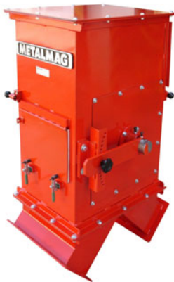
Carcaça padrão, com um Tambor Magnético