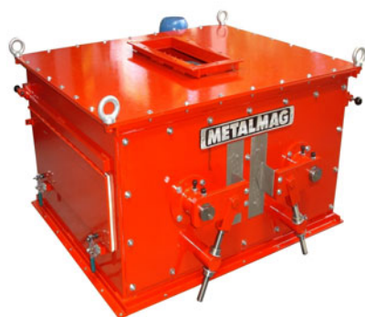
Modelo especial, com dois Tambores em paralelo, para grandes vazões em situações com pouca altura disponível