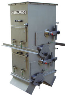
Modelo duplo, com dois Tambores em cascata, para separação fina, com carcaça em aço inoxidável