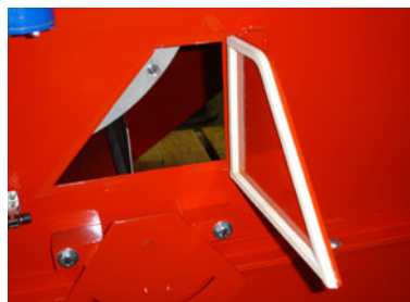
Porta de inspeção para acesso ao defletor regulável, para otimização da separação